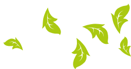
Illustration: ZEP / @graphisme.voelimgas.ch