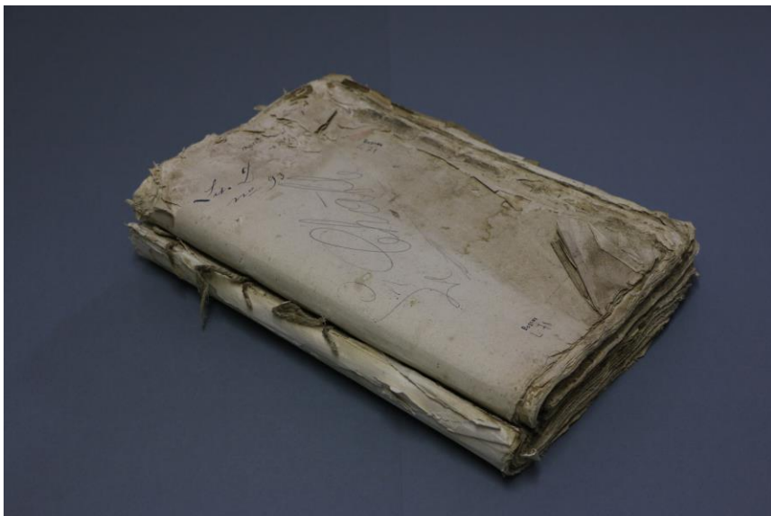
Livre des maxes de la commune de Bagnes pour le village du Châble, 1800-1810. (Cote : AC Bagnes, L71).