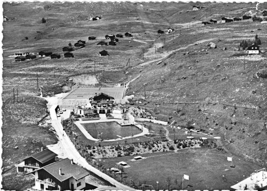
Photo : La piscine extérieure de Verbier, années 1960.

Successivement, une piscine extérieure semi-olympique avec plongeoirs et toboggan (inaugurée en juillet 1960), trois terrains de tennis, des paniers de basketball, des tables de ping-pong et des jeux pour enfants apparaissent dans le territoire. L'ensemble récréatif est complété par la construction d'un bâtiment comprenant un restaurant avec une terrasse de 150 places – géré à son ouverture par deux membres de l'équipe nationale suisse de ski, Andeer Flurin et Margrit Gertsch –, des vestiaires et deux rangées de cabines privées s'ouvrant sur la piscine. Le projet est financé par la Société des aménagements sportifs de Verbier.