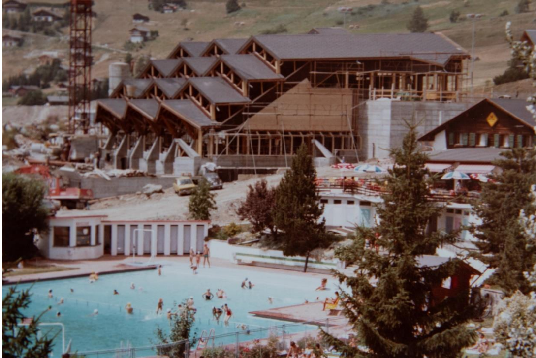
Photo : Les travaux sont toujours en cours mais l'accès à la piscine reste possible.

d'Europe consacrée au bois. Plus de 75 tonnes de clous, de vis, de boulons et de pitons sont intégrés à la charpente considérée comme avant-gardiste pour l'époque. 120 nœuds d'assemblage et 7 éléments porteurs de 40 tonnes chacun soutiennent cette colossale structure caractérisée de « cathédrale de la détente ».