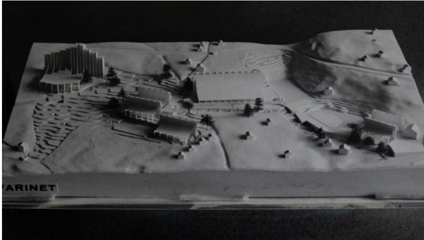
Photo : Maquette d'un projet du concours d'idées du centre polysportif de Verbier.

A la suite de ce sondage, un cahier des charges est élaboré et un concours d'idées est lancé : on projette la création d'un centre polysportif avec un hôtel de deux cents lits et une salle de congrès. Nonante bureaux d'architecture de toute la Suisse y prennent part et 45 projets répondent aux conditions. Leurs maquettes sont exposées au public à la gare de TéléVerbier, en juillet 1973.